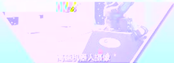
高精度机器人摄像